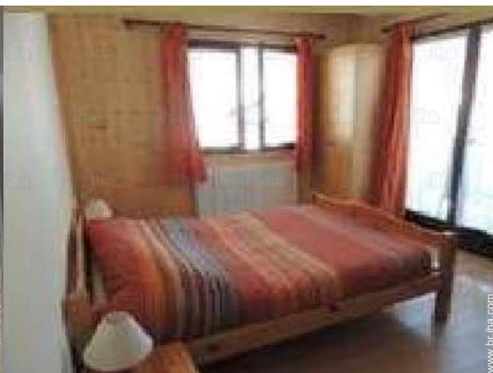
Dormida - cama(s)