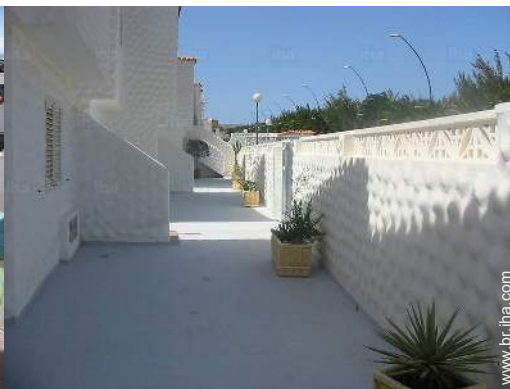
vista a partir da cozinha